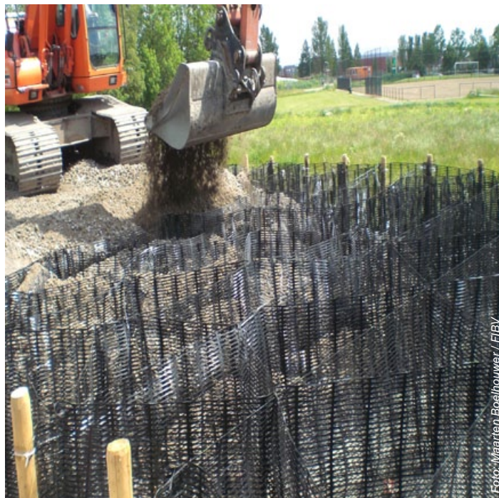
De opbouw van de geomatras.

Om het effect op de bestaande rondweg en de nabijgelegen gasleiding te monitoren heeft Fugro 36 hellingmeters geplaatst om de horizontale grondverplaatsingen te meten. De gemeten horizontale